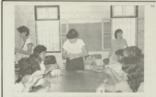
مجموعة اخرى تقوم بتجربة القصب بالطين كبرياء من اعدادهم