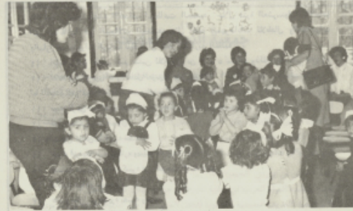
الاطفال الروضة يشاركون في احتفال عيد الام

وتعتبر الروضة ودار الحضائفة منذ السنة كمختبر نربوي ، ويمطي المجال للعاملين المختصين بالمركز النربوي "دار الطفل العربي" القيام بتطبيق النظريات والمفاهيم النربوية الحديثة بعد ان يتم تطويرها وملائمتها لحاجات مجتمعا ، وكل هذا يهدف الى رفع شأن الروضة والطفولة الى المستوى الامثل .