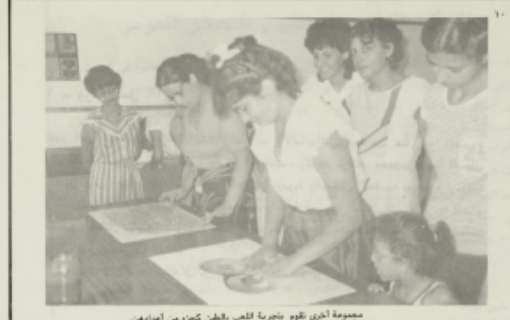
مجموعة اخرى تقوم بتجربة القصب بالطين كبرياء من اعدادهم