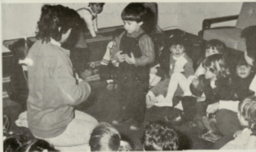
فناء، حفلة طفل