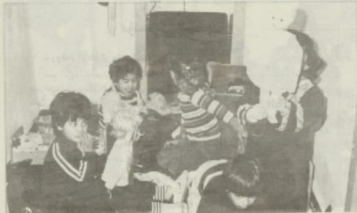
فسم من اطفال الروضة أثناء لعبهم الحر في بيت اللعباء