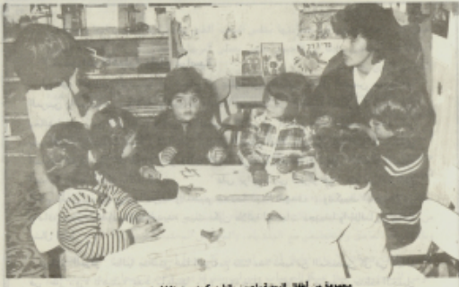
مجموعة من اطفال الروضة ياجون بالطين كبرياء من نشاطهم