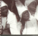
مسرحية سبع الزمان الهمداني

نعلن عن التسجيل ل: دورة رقص معاصر وتعبيري للكبار مع وفاء زاروبي