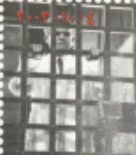
مسرحية درويش يا سيد