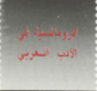
أبروفا نسبا في الأدب العربي