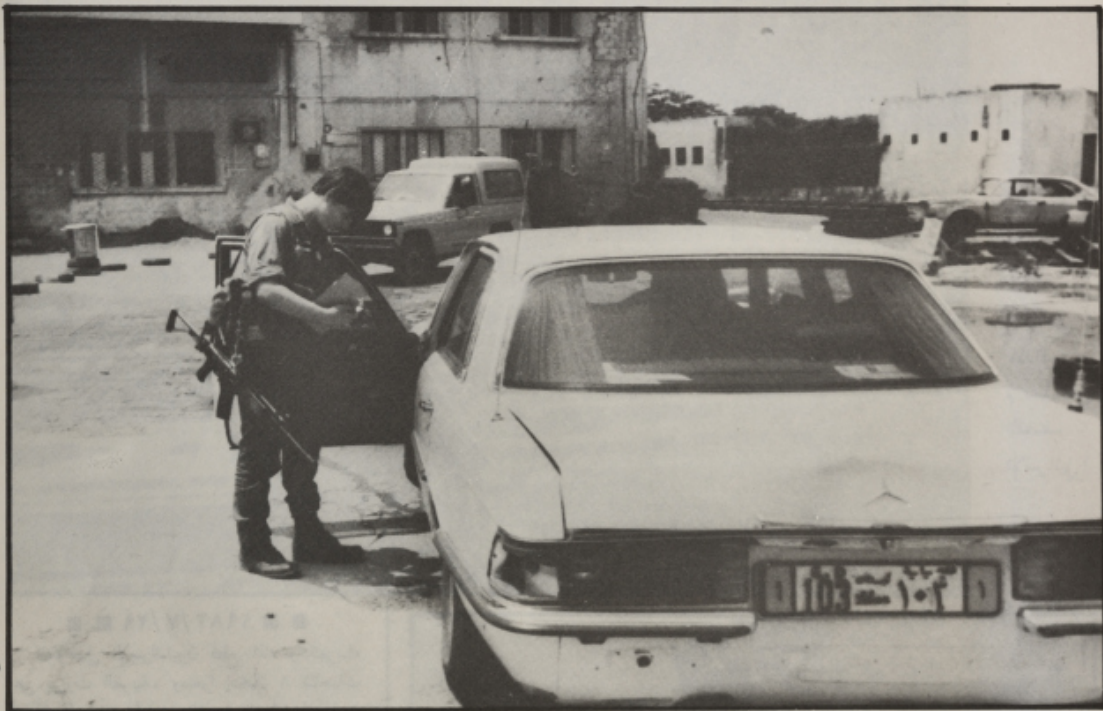
حاجز إسرائيلي في المرفأ يفتش سيارة السفير الألماني