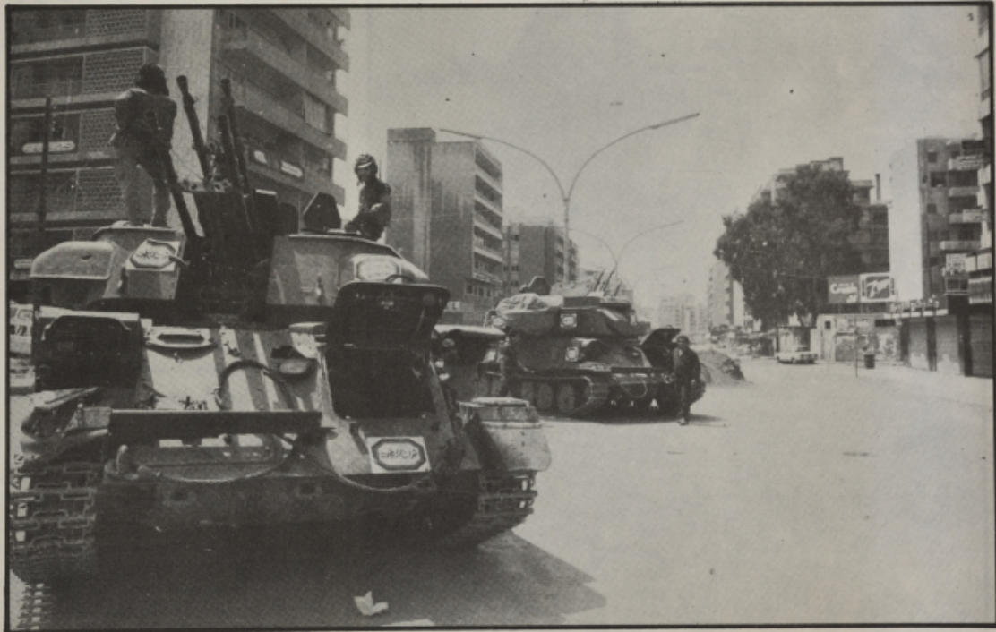
دبابات لـ القوات المشتركة، في كورنيش المزرعة