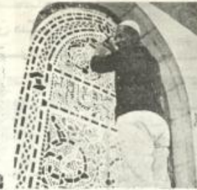
عذبة لصق الزجاج الملون خلف الشباك الداخلي