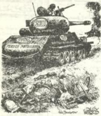
السياسي للاستراتيجية الأمريكية خاصة والغربية عامة في منطقة الشرق الأوسط.

دولار، واليابان، وفرنسا، والبريطانيا العربية ٧٠٠ مليار أما بقية دول أوروبا فتقدم ٢٠٠ مليار.