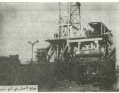
موقع الحفر في أبو شخيدم

وعلمت "الطليعة" أن عملية التنقيب ستستمر ثلاث سنوات - وأخير أحد الخبراء السكان بأن البترول موجود في المنطقة - وأن استخراجها في الوقت الحاضر - وبعد