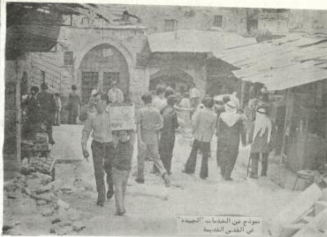
مخرج من الخدمات الجديدة في القدس القديمة

البياع التي طلب من احد المعابر الصغيرة دفعها بعد سنة ٦٧ ضريبة الدخل = ١٢ ألف ليرة في السنة مساحة = ٣٣٣٦ ليرة في السنة تأميمات = ٢٤ ألف ليرة في السنة .. ٦٤٨ ألف ليرة في السنة .. ٢٤ بالمشة = ٦ ألف ليرة في السنة .. قبل سنة ٦٧ لم تعد في جميع الضرائب التي دفعها صاحب هذا المحجر ما قيمته ٥٠٠ ليرة اسرائيلية في السنة وهذه الضرائب: ضريبة الدخل (نسبته هي ٥ بالمائة من الدخل فقط) ضريبة الحرف والمهنة .. ضريبة المصارف .. (حوالي ١٠ ليرة في السنة) ضريبة الاملاك ..