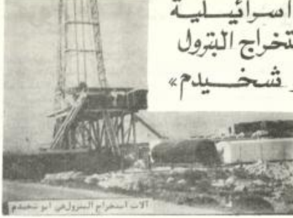
آلات استخراج البترول في أبو شخيدم

مطالبته بزيادة أجور - تقدمت بمرحلات ومطالبات مستشفى الكرناس للأطفال إلى إدارة السنطى بطلب زيادة وتحسين الأجور - ولا زالت الطلوات جارية بهذا الشأن بين الإدارة والمعلمين.