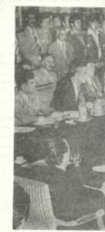
احدى جلسات مؤتمر بغداد

الحاضر حملة دعائية هدفها احوال النار على السادي - والاس التي سم الاتفاق عليها حول الادارة الدانية وستعملها في كتاب ديبعة وانفعال نقاش يصددها وكان المفاوضات سائها سيجري فوق ارض عذرا . لقد كان ينبغي اصرح المتكسرين في "كتاب ديبعة" حينما قال ان الادارة الدانية ستكون للمساكن فقط وانها لن تؤدي لقيام دولة فلسطينية . ولكن الطرفين الآخرين كارتر والسادات يحاولان الانهزام بان الامر