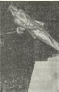
أمران الثورة تسفر

وستتمكن هذه الزيادات في الأسعار وما سبها من زيادات كبيرة على مختلف السلع شكل ملمس على