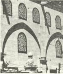
الشبابيك الحصينة الشرقية للمسجد الاقصى