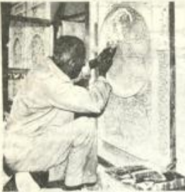
الرجلة الدقيقة: عذبة حفر الجرس