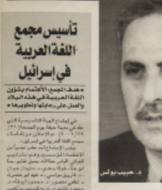
تأسيس مجمع اللغة العربية في إسرائيل

صدر كتاب هام عن التجربة المسرحية العربية المحلية، تأليف الكاتب المسرحي المعروف. الكتاب يناقش دور المسرح في المجتمع العربي، وكيف يمكن استخدامه كأداة للتغيير الاجتماعي. الكتاب هو جزء من سلسلة من الدراسات التي تبحث في الثقافة العربية المعاصرة.