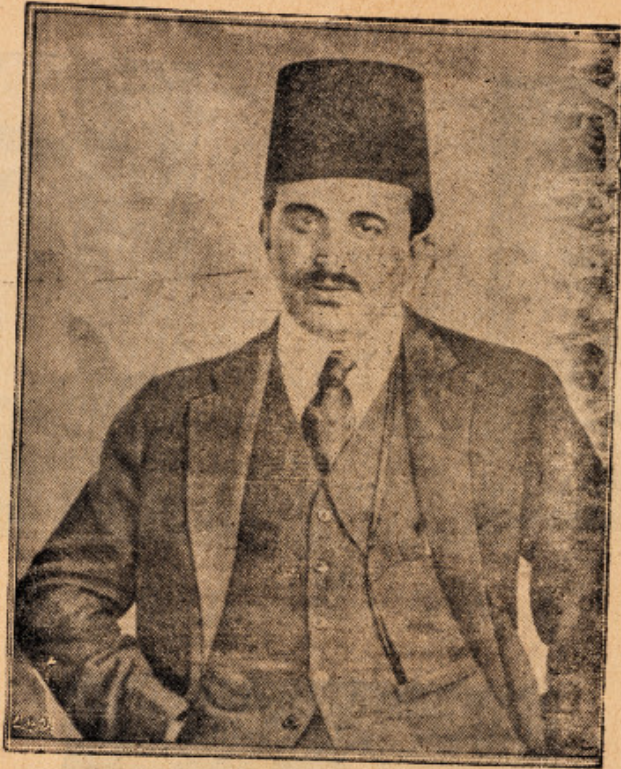
الاستاذ امين الريحاني