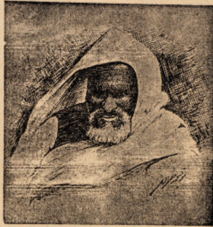
الشهيد عمر المختار بطل طرابلس