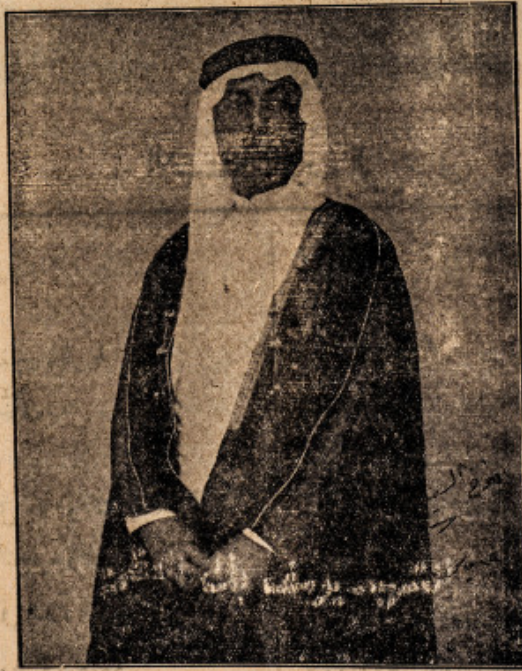
الامير عادل ارسلان بالعباءة والكوفية