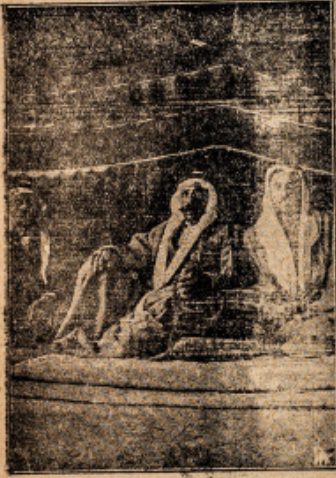
الامير عادل ارسلان لباس التوزه

سلطان باشا الاطرش وشقيقه زيد بك الاطرش في الخيمة