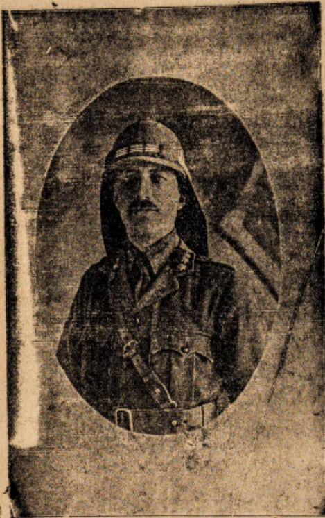
الشهيد يوسف بك العظمه