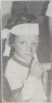
جهود تنكف مع احتياجات المصنع

ونوعت النشرة الى "يت مختلف شبكات التطريون الاميريكية لفيلم "ربالة" من فلسطين"، خلال ايار الماضي، من اخراج صنيف يورك، مخرج الافلام الوثائقية الاميريكي، حيث يعرض الفيلم صورة خلاصة عن الدور الجماهيري في "الاحداث" المضربة، في مثال نشاط الاغاثات الطبية، ان تابعتم خدمة الكثير من منظوي الاغاثات، خلال نشاطهم اليومي، ويرى الاتحاد اميرة الفيلم "في قدرته على دفع المساند لآثارك دور