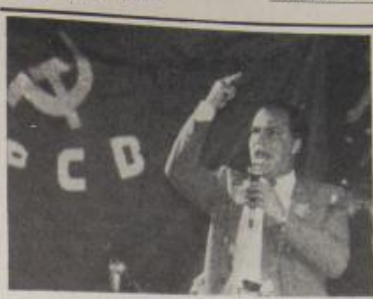
فيرير في أحد التظاهرات الانتخابية

يعني ان بقدر الشيوعيين الآن ان يتبنوا بجدارة ومثوية قيادة الحزب الشيوعي.