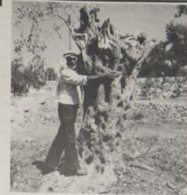
واحدة من الاشجار التي قطعتم في الجيب يوم ١٨/٧/١٩٨٩

كما علم ان السلطات الاسرائيلية تستعين بالمتقاعين الذين اوجه فهورم برفقة قوات الجيش خلال