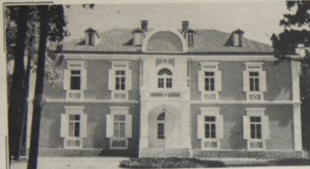
متحف العالم الثالث على اسم تيتو