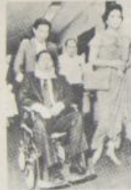
ماركوس على كرسي القعديين

بعد ان لفظه وطنه "بوفور" السويدية للأسلحة ، من خلال انشاء شركات وهمية وإيداع حسابات لها في البنوك السويسرية باسماء مسؤولين هنود ، هؤلاء ابرام بقود مع الشركة السويدية . وتشير الترامبات الى ان هذه مجرة عينات لطوع نسبة كبيرة من حكاهم العالم الثالث في صفقات مشبوهة ، يجري تمويلها بفروص ، بحيث يتم استيراد معدات وأجهزة بأضعاف المائتها ، مما يعني مولاة الحكام والشركات متعددة الجنسية لانشاء علاقات يجري تمويلها بفرانك سويسري تستخدم فيها كافة وسائل التحويل .