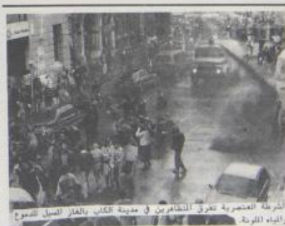
الشرطة العنصرية تتفقد المشاهدين في مدينة الكاب بالغاز المسيل للدموع

اتحاد الانبياء الواردة من جنوب افريقيا ان الحزب الوطني الحاكم يقف على عتبة اجراء تبدلات ايجابية على نظام التمييز العنصري (الابرتهايد) تحت ضغط الحركة الشعبية المناهضة لسياسة التمييز العنصري والعزلة الدولية التي تعاني منها حكومة جنوب افريقيا. ومن المؤشرات الدالة على هذه التبدلات التصريحات والاجراءات التي اعلنها رئيس النظام العنصري الجديد فريديريك دي كلارك.