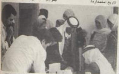
تتم تغطية بعض الخدمات الصحية الحكومية بجهود المؤسسات المحلية المتطوعة في الغزير.

نشرت مصادر طبية في المستشفيات الحكومية وخدمات الوكالة بقطاع غزة، ان مرض الرمد (معلومة العين) قد انتشر في القطاع في الاونة الاخيرة، ومن المعروف ان اسباب انتشار مرض الرمد، بصفة، هو وجود الدباب بأعداد كبيرة في القطاع، وخاصة في مخيمات اللاجئين، نتيجة لتداعي المباني، مما يتطلب تصفير هذه المستشفيات المحلية، وكنة الطوب والافاق، للاعتناء بالمواطنين. هذا واصدرت الوكالة بفرقة تفريقية حول المرض، تعهدت فيها لتأمين بعدم ملامسة جيوبهم، وان حدث وخاصة عند وضع افرهم، فيجب غسل اليدين جيداً ثلاث مرات يومياً، وكذلك تجنب استعمال فوط ومناشف ومعدات مشتركة.