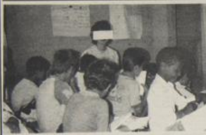
لم ينس هؤلاء بعد مقادهم لشكوة من قطع الطوب في مدارس التعليم العام.

مع صدور هذا العدد، يكون طلبة مدارس الضفة قد انهاء، حسب الموعد المقرر وسعياً، تقديم امتحانات نصف السنة. وسط مخاوف، من احتمال اجهاض العام الدراسي الحالي الذي ابتدا على مراحل في اواخر تموز الماضي، ان تأخر دوام طلبة المرحلة الثانوية حتى ٨٩/١٢.