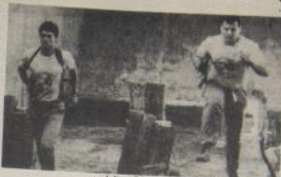
فراخند "المعتمد" الخاصة قرب تل أبيب