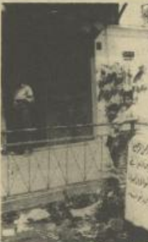
نصب تذكاري لشهداء اقامة الشبان في قصبة نابلس