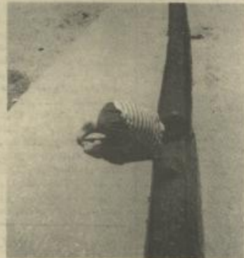
مستلزمات جارية في الحي الغربي بمعسكر الشاطيء