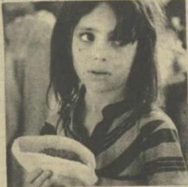
طفلة تتناول شطيرة من أحد مراكز التقفية الاضافية

البرنامج وزما غنائية تحتوي على سموات حرارية وديوتين أكثر من السابق. وان التوزيع سيبدأ اعتبارا من مطلع العام المقبل، وسيستمر طالما استمرت عمليات الطوارئ في