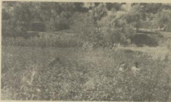
يقطفون ثمار الخضار التي طاولت اشتغالها قدامتها المتكسبة.

استغلال أراض لا تصلح للزراعة، لأقامة بركس لزربية البقر الملوب، نظرا لحاجة المنطقة لاشتغال الألبان، ولكنهم لا يستطيعون توفير تكاليفها، وذلك فهم يبحثون عن ممول لنهم قرضا بشروط سهلة لأقامة تعاونية متكاملة تكفي لأعالة ٤٠٠ شخصاً. وهناك صعوبات أخرى جراء الانخفاض التكرر للمياه من القرية من الخطوط التي تزودهم بها مصحة مياه رام الله، مما يضطر الأمالي لاستخدام النبع للأغراض المنزلية فنقل كميات المياه الممكن استغلالها للري.