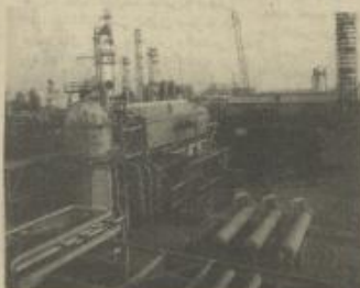
تسبح العراق الآن يبعده عن ٢٠٠ من احتياطي النفط في العالم

يعد الخبراء الاقتصاديون في البلدان الغربية من قلقهم البالغ من إمكانية أزمة الخليج العربي على مسار التطور الاقتصادي في البلدان الصناعية والعالم بوجه عام.