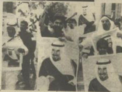
الرجاء الكويتيون في الدول العربية. معمل الاستثمارات الكويتية يتفقدون رطلين صود الأمير جابر.

بعد أن قررت الحكومة الكويتية تخصيص جزء من موارثها للأجيال القادمة، في محاولة للتغلب على التي العهد من الاعتماد على عوائد النفط لخدمة وفي العام الماضي فاجتازت عوائد الكويت من هذه الاستثمارات عوائد النفط، إذ بلغت ٨٠ مليار دولار مقابل ٧٠ مليار دولار من عوائد النفط.