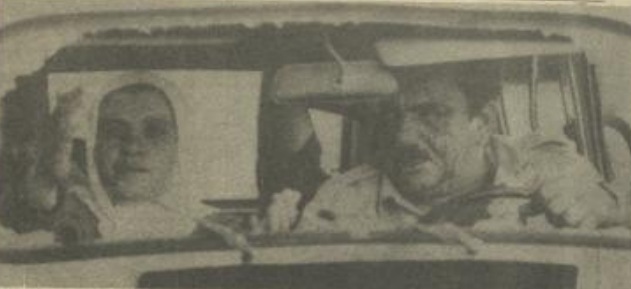
نتيجة الاعتداءات الهستيرية على المواطنين العرب على طريق القدس الخليل

هذا بالإضافة الى تهديم حوالي ٣٥ سيارة عربية بشكل متعمد والاعتداء على مشاتل التارل. وقد البقية ص ١١