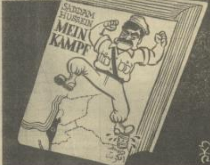
مكدا عبرت "مارس" الاسرائيلية (٨/٢) من تصورها لخطوة صدام التالية

نسبت "يديعوت" ٨/٣ الى من وصفها بمصادر علية في الادارة الاميركية بان "الغزو" العراقي للكوييت سيمر الى حد كبير مكانة اسرائيل في الولايات المتحدة بعد ان ضعفت كثيراً. فاسرائيل تظهر بصفتها الدولة الديمقراطية الاكثر استقراراً وقوة في الشرق الأوسط والتي يمكن للولايات المتحدة ان تعتمد عليها في حالات الطوارئ".