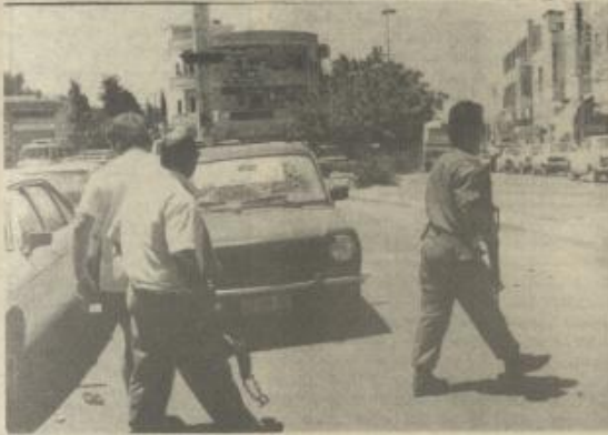
تخطيط زجاج سيارة مستوطنين. ميدان المخيم / رام الله (٨/٢)

٨٥٠٠ شكيل لتحرير سيارته، ويوم أمس الأول صودرت ٢ سيارات في القدس محملة بالخطار والفواكه تبلغ قيمة حمولتها ٤٥ ألف دينار. وتعود لأصحابها حملي جوياس من بيت حنينا وهرقات محمود ابو عرقه واسحق النشئة بجمعة مخالفتهم أمر منع ادخال الخطرات من من الضفة الى القدس.