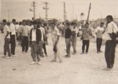
بعض العمال الذين وصلوا جابر ايز من ساعات الصباح الباكر، ولكن ارباب العمل لم يأووا لاطلام

مكتب العمل وتصفوا الآخر نقدا وبطريقة غير قانونية. وتصل في كشفات مكتب العمل الوهمية التي يُدفعها صاحب العمل بواسطة شيك مكتب الاستخدام. وبالتالي فإن قيمة التعويضات التي يتلقاها العامل (التوفير ونهاية الخدمة الخ) تكون مناوية لاجرة الوهمية - أي نصف مستحقاته.