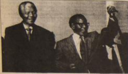
مانديلا ونائب رئيس المؤتمر الوطني الافريقي التمثيلي والغري

ماذا كان رد الفعل الافريقي على المساعي الاميركية لانهاء الحاقطة الاقتصادية؟