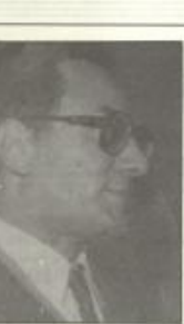
● غالي شكري ●

وقد فهم إضافة إلى النقد الأساسي الذي تكتل كتابات شكري. أعاد والنقد البيروقراطية التي عليها كتابات سارا قاسم وصالح عطيل والنقد في ما بعد التسمية وكثبات فريال غزل وصبري حاطر وبدا النقد الجديد الذي تتخلل منه كتابات مصطفى تامر وعصود الريسي. ولا يفرق هذه الحركة ومملكتها بالنص الأدبي من الناحيل ومملكتها في سحر الحزقي يفرق جابر عصفور أنها توتي أكثر من دور على مستوى الترجمة وعلى مستوى الترفيع بالنقد. وعلى مستوى الطيفي والتعريف والملاحظات الواعدة لكن عصفور فقد إلى أن هناك نظرة مسيحية إلى ملامح الاتجاه الجديدة بوجه خاص غير أن عليه أن لا يلاحظ ونكثرة أنه كما أن التيارات الأدبية الحديثة تخلق ملامحاً للنسبة إلى المجتمع فالتأثير قد من بعد التصريح القديم الحركة النقدية فالتأثير حيدبيون وباشاها.