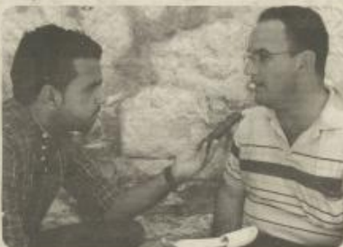
* By the United States District Court