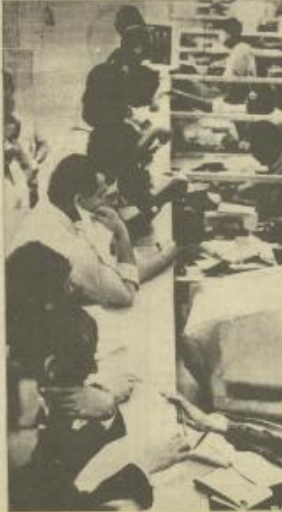
مجموعة من الموظفين في مكتب