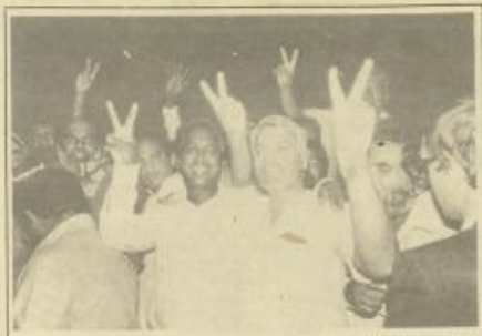
Available in paperback £5.95