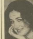
— 1987 —

في فيلم «البحر» - من تمثيل دور بول في فيلم «البحر» - من تمثيل دور الاستاذ لوكي يمثل دور في فيلم «البحر» - من تمثيل دور في فيلم «البحر» - من تمثيل دور في فيلم «البحر» - من تمثيل دور