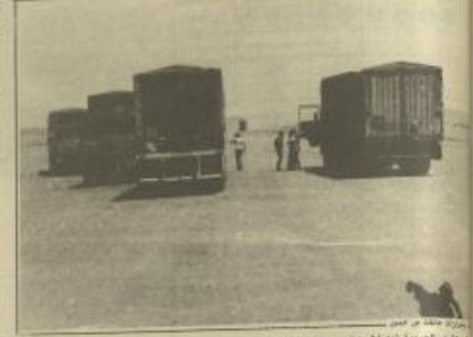
معدات ثقيلة في الصحاري دون استخدام

البيروقراطية والتبذير وضعف الابتكار تركت آلاف المعدات الثقيلة مرمية في الصحاري دون استخدام، وهي كلفة إعادة اعمار لبنان والمثل العراقية الحدودية