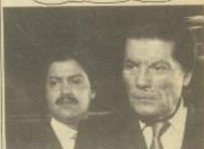
Journal of Management Education 30(6)p.789-802

يتمثل شكري سرجان، وربما أشهره لوالدها، ميمدا، ممثل الفتاة وحسن سرجان وطلبة الجامعة.