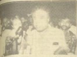
• • • • •