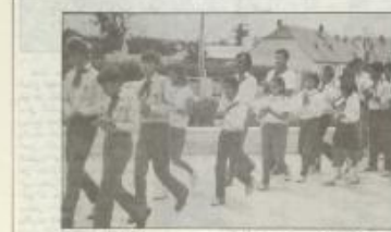
١٤ الوفد السوفيتي في زيارة لـ ١٠٠٪ في الاتحاد السوفيتي