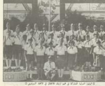
١٤ الوفد السوفيتي في زيارة لـ ١٠٠٪ في الاتحاد السوفيتي