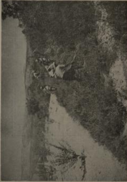
الطلاب يعملون في الماء الأرض