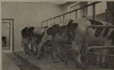
يسى المعهد بترية الوالهي وتدريب الطلاب على صناعة الايدان