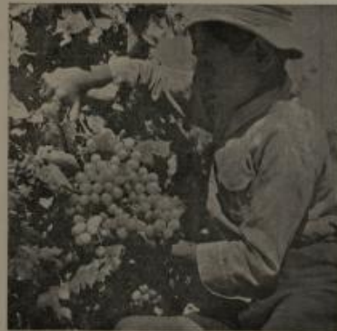
منتج يطفأ منتوجات العنب الاولى في المعهد