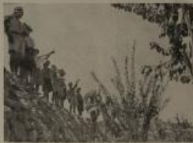
كل واحد منهم يقول لاشيه : اعمل فأسك وانهمي