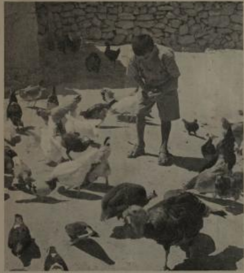
الدراجن ياتوا بها ، يرتعها المقلب بمنايا ودقة