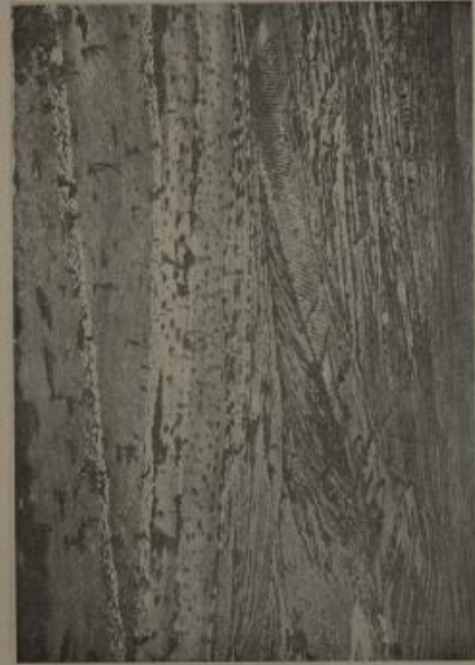
الطلاب يعملون في الماء الأرض - في المنطقة أعمال البنية وفي التربة ويستخدمون السحق وأشجار القواكه الأرض